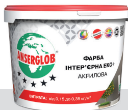
відповідає ДСТУ EN 13300