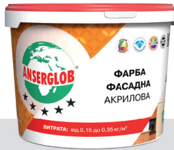
відповідає ДСТУ EN 1062-1