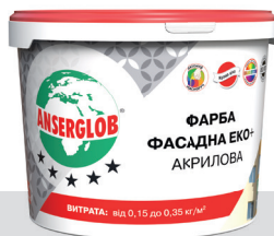
відповідає ДСТУ EN 1062-1